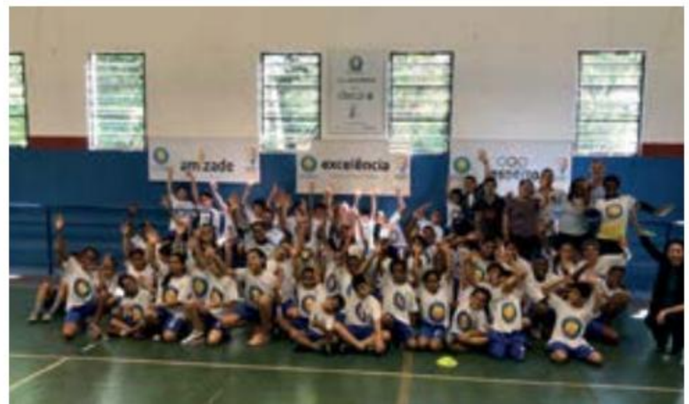
Animação para o começo das aulas