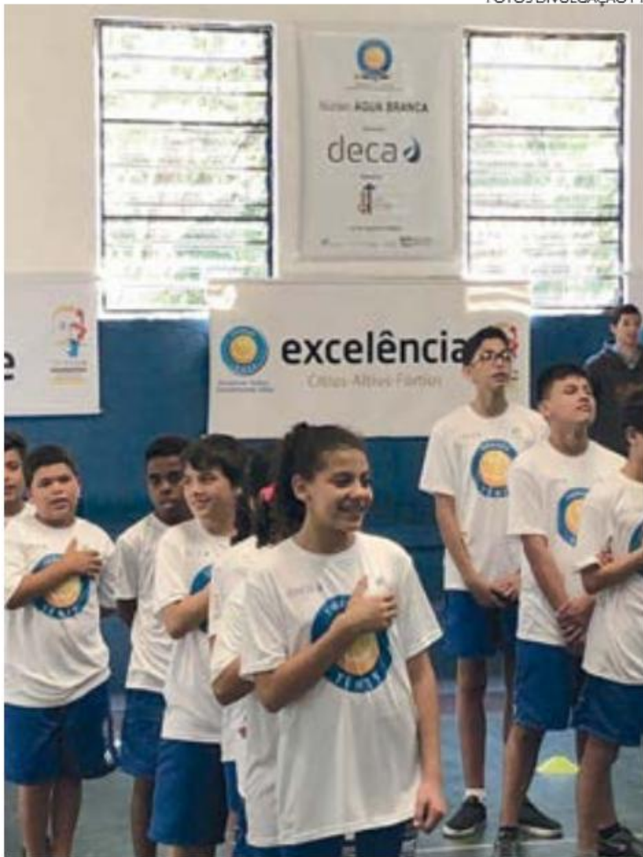
Alunos cantando o hino nacional em Água Branca, São Paulo

A expansão é resultado da entrada de novos mantenedores e de um trabalho em conjunto da diretoria da Fundação Tênis, coordenadores, professores e demais colaboradores da entidade. É percebido em cada depoimento de alunos, ex-alunos, familiares e professores que o caminho a ser seguido está correto. As crianças absorvem os Valores Educacionais Olímpicos transmitidos pela instituição, desenvolvidos durante as aulas, e levam para diversos momentos de sua vida.