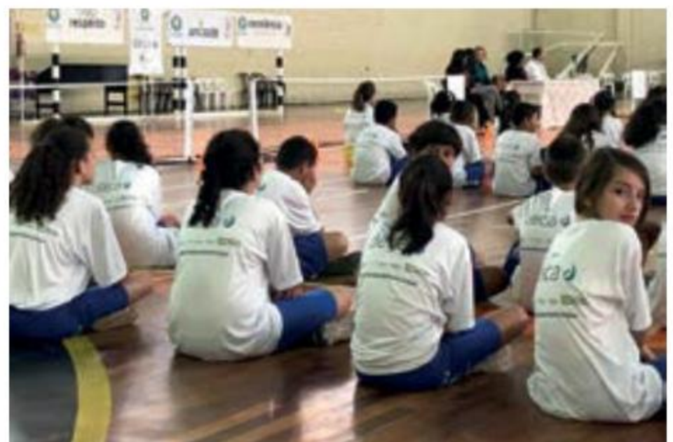
Alunos atentos ao ritual de abertura